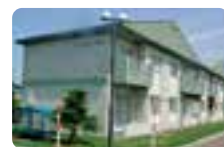
リバーサイド団地