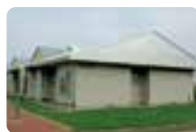
さくらんぼ団地 (公営住宅)