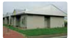
さくらんぼ団地 (公営住宅)

・ペット(犬・猫などの小動物)の飼育は禁止しています。 ・駐車場所については、各戸につき1台分です。