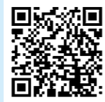
清里町議会事務局 YouTube

議会では、インターネット(You Tube)によるライブ中継(生中継)と録画配信を行っています。傍聴に行けない方など、ご家庭のパソコン、スマートフォン等でご覧いただけます。ぜひご利用ください。