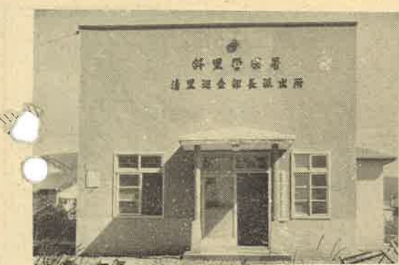
清里巡査部長派出所 新築されました

今回の一斉調査によつて、決定された評価額は、昭和三十六年度から三年間適用されます。