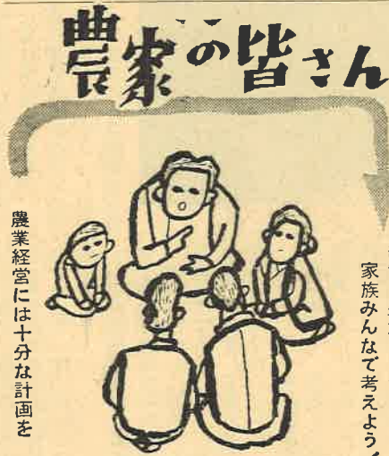
農業経営には十分な計画を